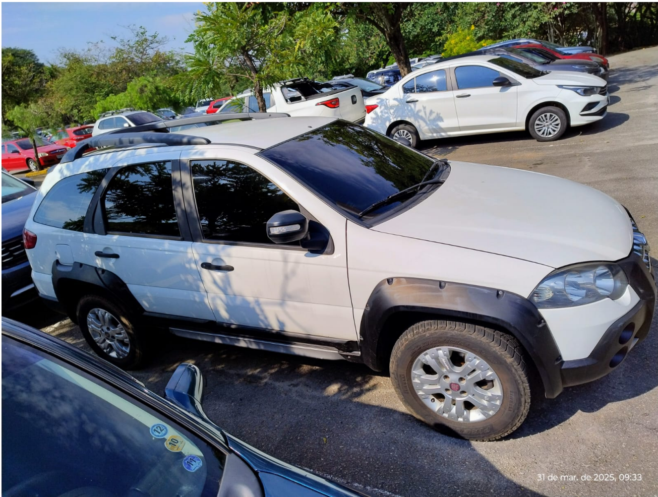
2.8.1.3. Visão Lateral Esquerda: