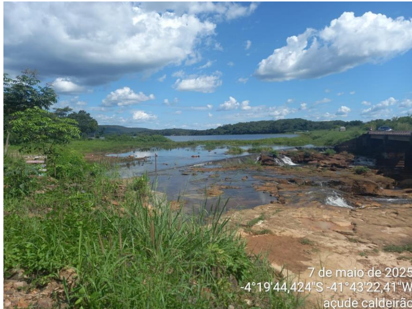
Figura 2 - Vista frontal da ponte sob o vertedouro da Barragem