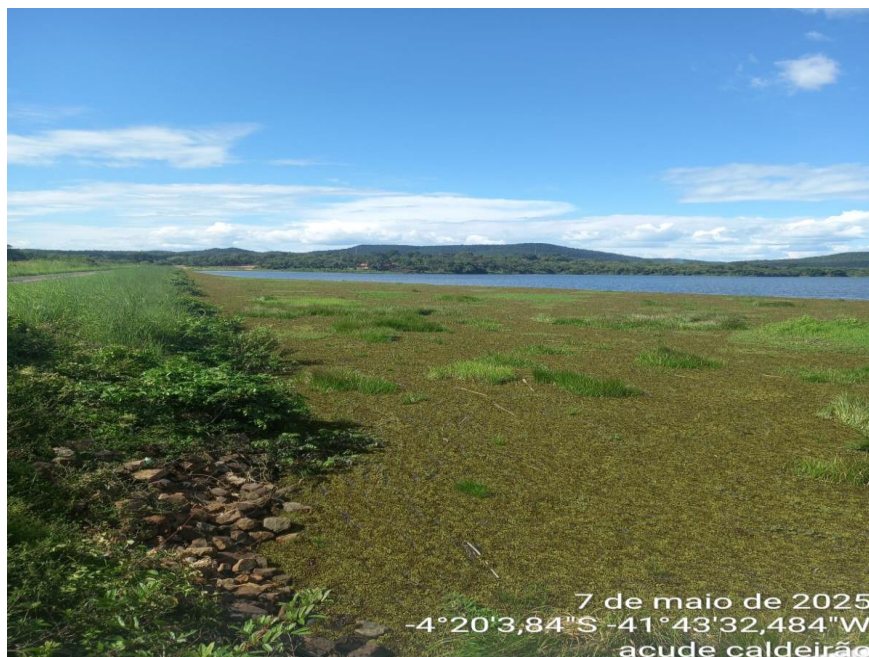
Figura 3 - Vista lateral do montante da Barragem