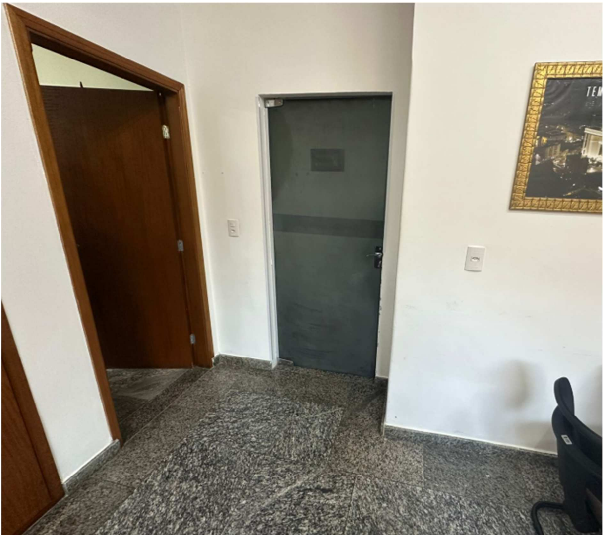
Figura 2 - Portas para os ambientes internos da Câmara Municipal.

O diagnóstico aponta que as janelas e portas existentes são os principais responsáveis pela falta de privacidade acústica na Sala da Presidência. A baixa performance desses elementos representa uma não conformidade crítica com as necessidades funcionais do ambiente, que exige confidencialidade. A substituição desses componentes é, portanto, a ação de maior impacto e prioridade para alcançar o isolamento acústico desejado.