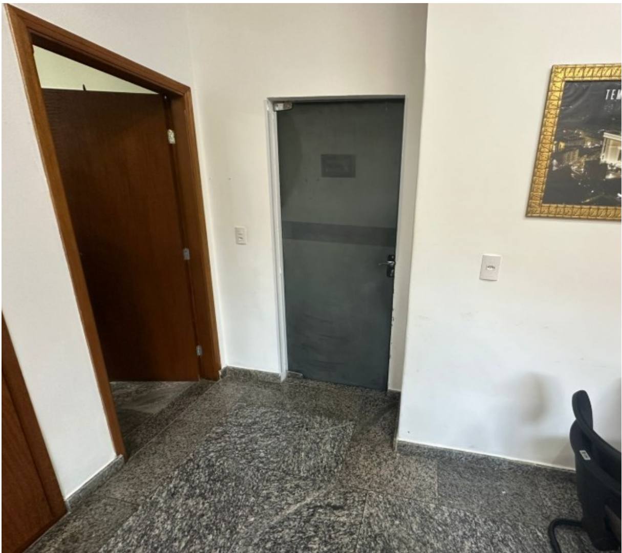
Figura 2 - Portas para os ambientes internos da Câmara Municipal.

O diagnóstico aponta que as janelas e portas existentes são os principais responsáveis pela falta de privacidade acústica na Sala da Presidência. A baixa performance desses elementos representa uma não conformidade crítica com as necessidades funcionais do ambiente, que exige confidencialidade. A substituição desses componentes é, portanto, a ação de maior impacto e prioridade para alcançar o isolamento acústico desejado.