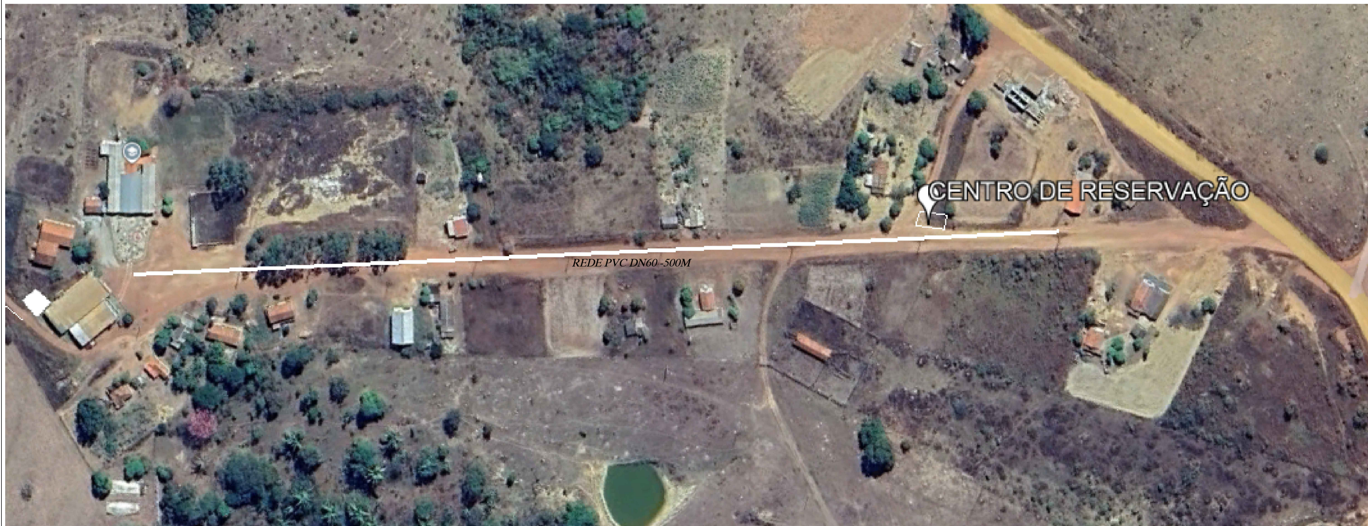
REDE DE DISTRIBUIÇÃO SEM ESCALA