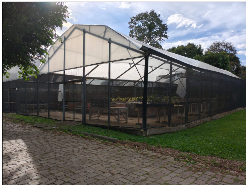
ESTRUTURA A SER DEMOLIDA - TELADO GRANDE