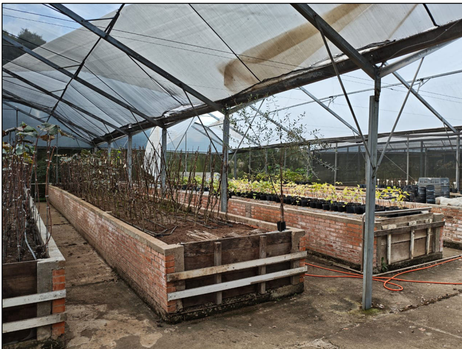
ESTRUTURA A SER DEMOLIDA - TELADO GRANDE