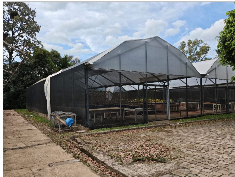
ESTRUTURA A SER DEMOLIDA - TELADO GRANDE