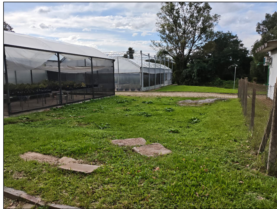
LOCAL DO NOVO PISO - TELADO PEQUENO