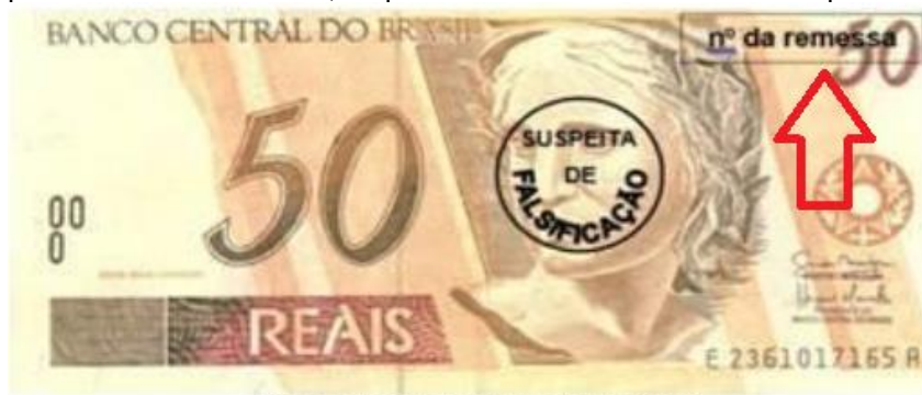
Exemplar de cédula da primeira família do Real