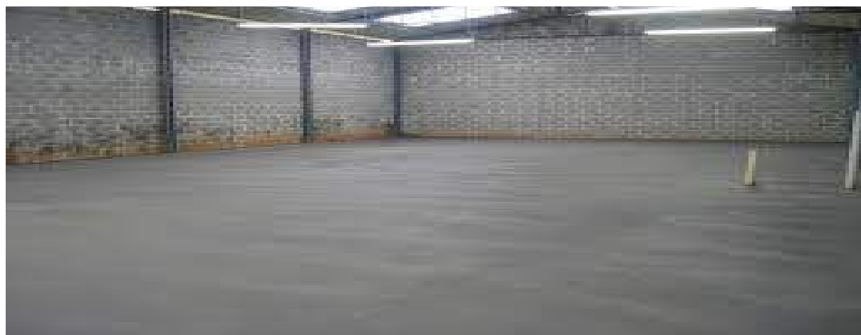
12. EXECUÇÃO DE PINTURA PAREDE E TETO