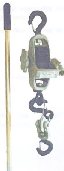
Imagem referência do item I: