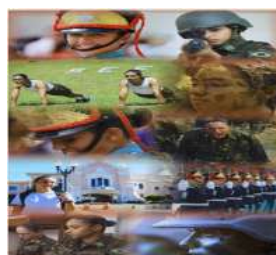
Fig. 03 – Artes Gráficas