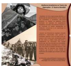
Fig. 02 -- Artes Gráficas