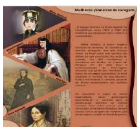
Fig. 01 – Artes Gráficas

As imagens abaixo, tem a finalidade de colaborar com a argumentação da necessidade da contratação dos serviços gráficos e suas plotagens para a realização da referida exposição: