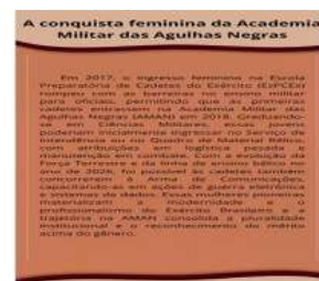
Fig. 04 – Artes Gráficas