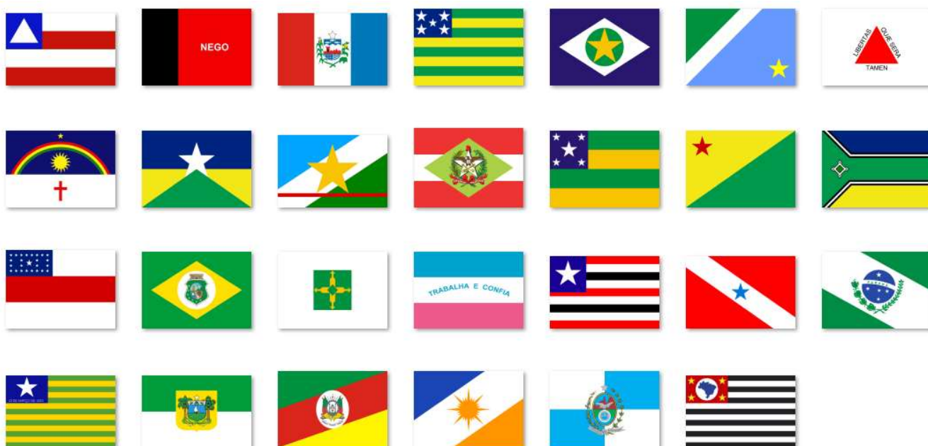
BANDEIRAS DOS ESTADOS DO BRASIL

Bandeira dos estados do Brasil, Material: Poliéster, Comprimento: 128 CM, Largura: 90 CM, DOIS PANOS, com ilhoses, Desenho: De Acordo Projeto. Especificações Características adicionais: dupla face, representação: todos os estados do Brasil. Cor: De Acordo Projeto, Conforme Modelos Abaixo: