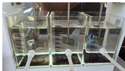
ENSAIOS DE TRATABILIDADE DE SANTARÉM-PARÁ.