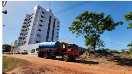
ETE MIDAS RESIDENCE SANTARÉM-PARÁ.