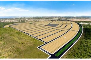
PROJETOS DOS SISTEMAS DE ABASTECIMENTO DE ÁGUA E DE ESGOTAMENTO SANITÁRIO DO BAIRRO CIDADE JARDIM - SANTARÉM/PARÁ.