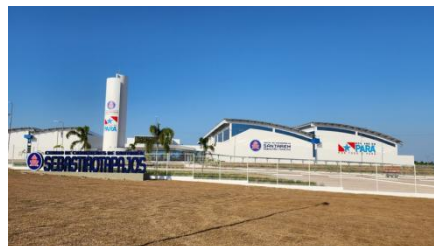
ETE CENTRO DE CONVENÇÕES SANTARÉM-PARÁ.