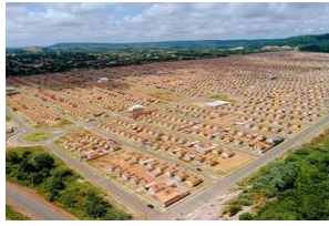
REVISÃO DOS PROJETOS DO SISTEMA DE ABASTECIMENTO DE ÁGUA CONJUNTO SALVAÇÃO - SANTARÉM/PARÁ.