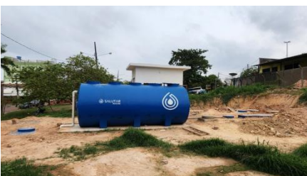
ETE RODoviÁRIA MARABÁ-PARÁ.