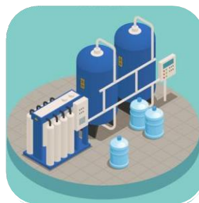
Manutenção, Operação e Monitoramento