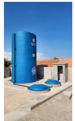
ETE BOULEVARD TAPAJÓS SANTARÉM-PARÁ.