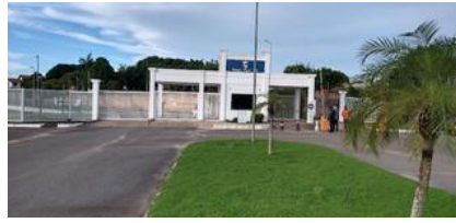
REVISÃO DOS PROJETOS DO SISTEMA DE ABASTECIMENTO DE ÁGUA RESIDENCIAL TAPAJÓS ROYAL VILLE - SANTARÉM/PARÁ.