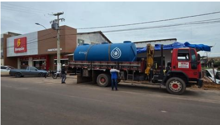
ETE BOMPÃO PANIFICADORA SANTARÉM-PARÁ.