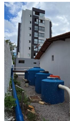
ETE CHÃO DE ESTRELAS SANTARÉM-PARÁ.