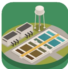
Cursos e Treinamentos