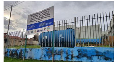
ETE HOSPITAL MUNICIPAL ANAPÚ-PARÁ.