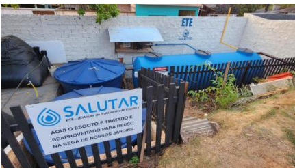
ETE DOM MANI. SANTARÉM-PARÁ.