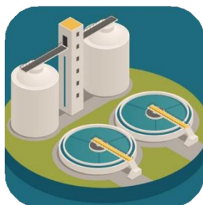
Consultoria, Estudos e Projetos