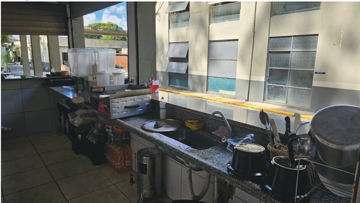
Imagem 02: Parte interna da cantina – área de preparo.