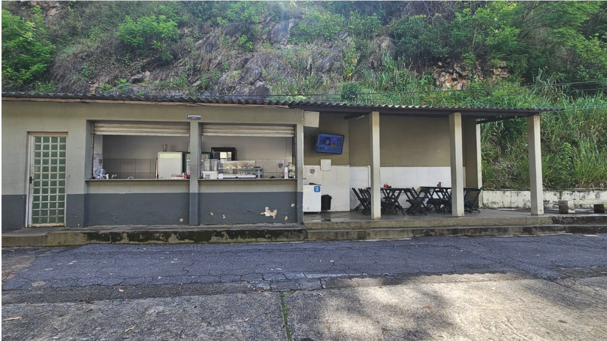
Imagem 01: Fachada da Cantina – QGI.