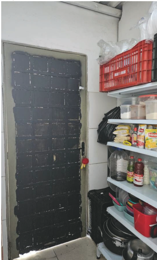
Imagens 05 e 06: Depósito interno da cantina e área de consumo de clientes.