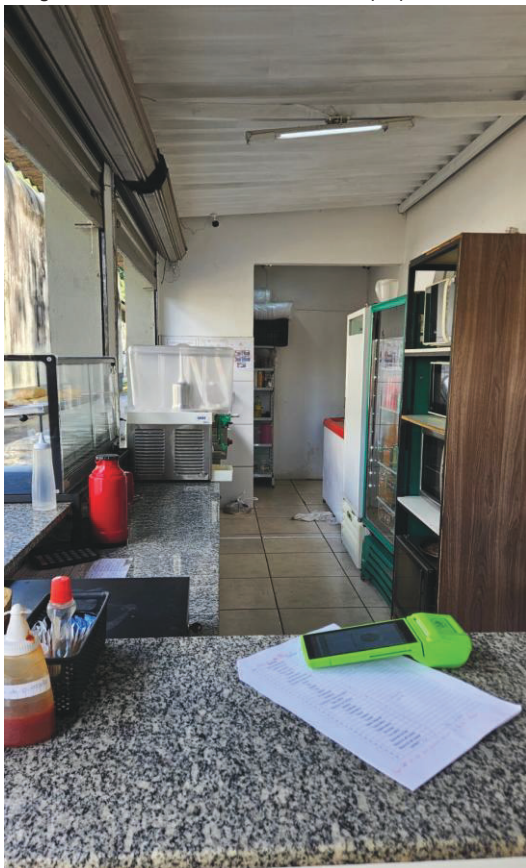
Imagens 03 e 04: Área de atendimento e preparo.