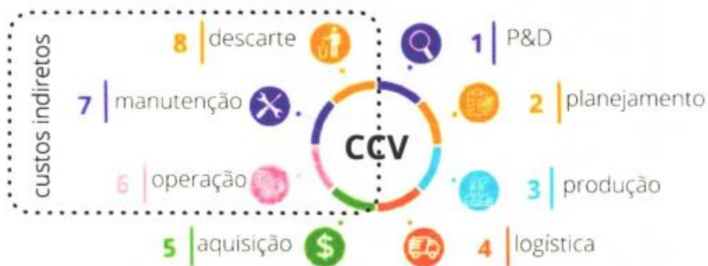
Figura I - Custo indiretos na perspectiva dos custos do ciclo de vida.

A metodologia da análise do ciclo de vida (ACV) deve ser considerada no modelo de compras sustentáveis. A análise do ciclo de vida (ACV) é obtida por meio do mapeamento das entradas, saídas e impactos ambientais potenciais de um sistema de produto/serviço ao longo do seu ciclo de vida.