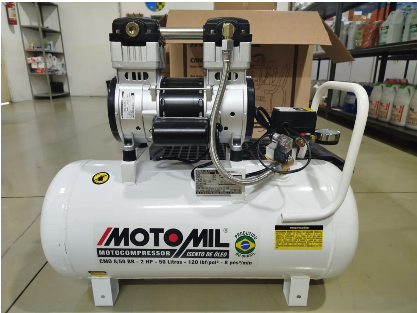
1.7.3 Imagem 3