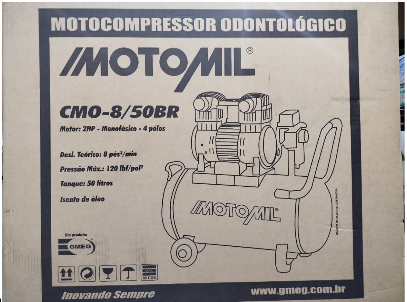
1.7.1 Imagem 1