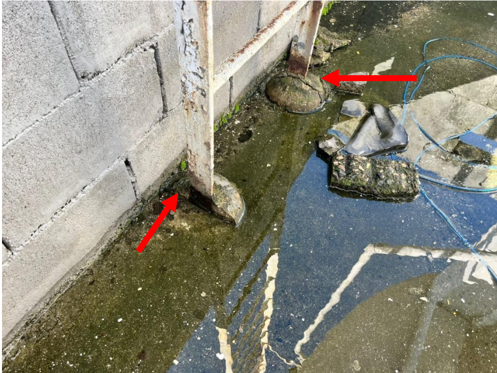
FOTO 6 – Pode ser observada a base da escada não existe, devido avançado estado de oxidação.