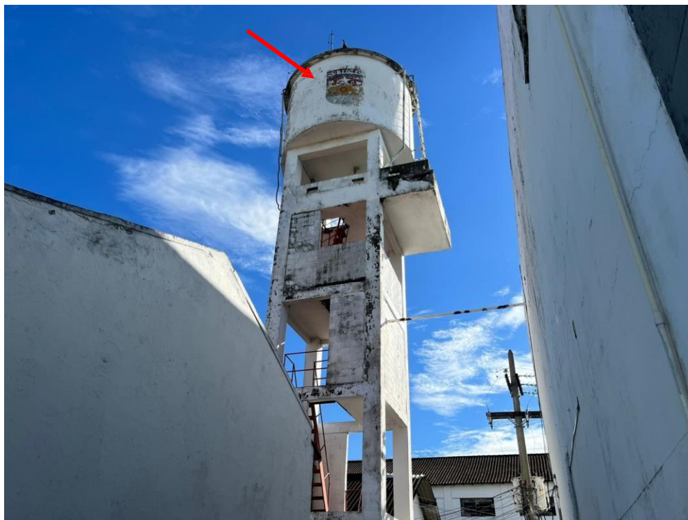
FOTO 2 – Vista aproximada do reservatório, podem ser observados diversos pontos da pintura deteriorada, expondo a estrutura ao desgaste.