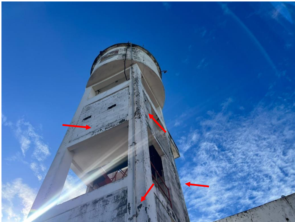
FOTO 4 – Vista aproximada do reservatório, podem ser observados diversos pontos da pintura deteriorada, expondo a estrutura ao desgaste.