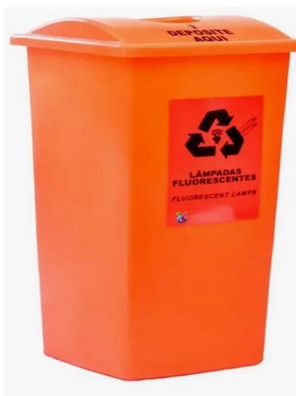
Item 2 - Coletor para lâmpadas tubulares 60 l