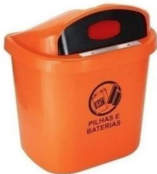
Item 1 - Coletor de pilhas e baterias 40 l