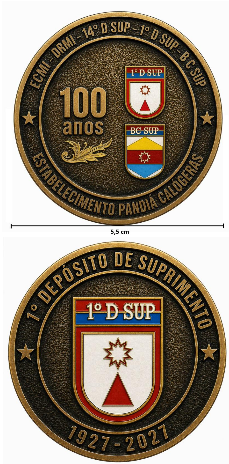
Modelo Item 03