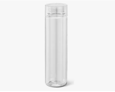
"Imagem Meramente Ilustrativa"