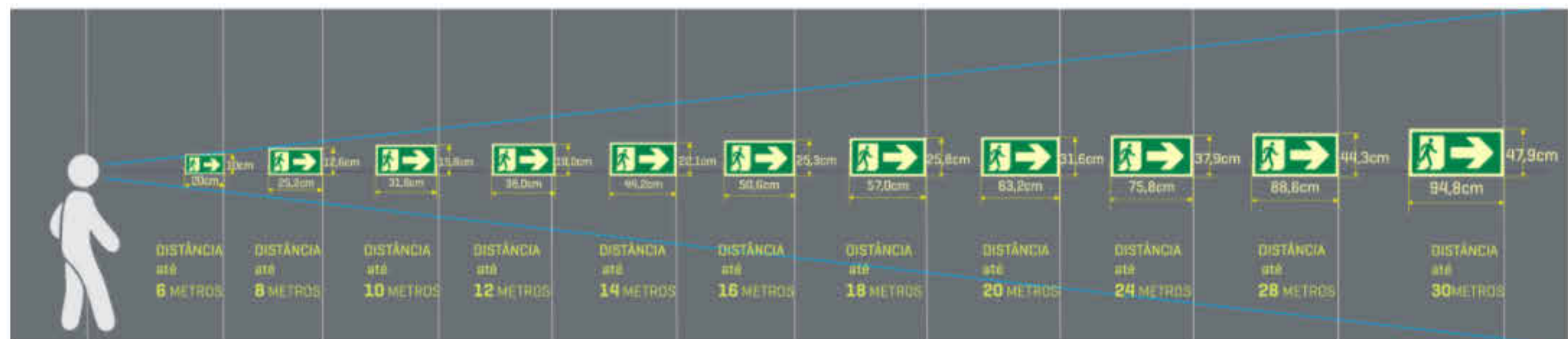
NBR 14434 Tabela 1 1 : 20

CARIMBOS DE APROVAÇÕES DE ÓRGÃOS LICENCIADORES