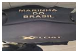
20241101_082935.jpg 3 MB