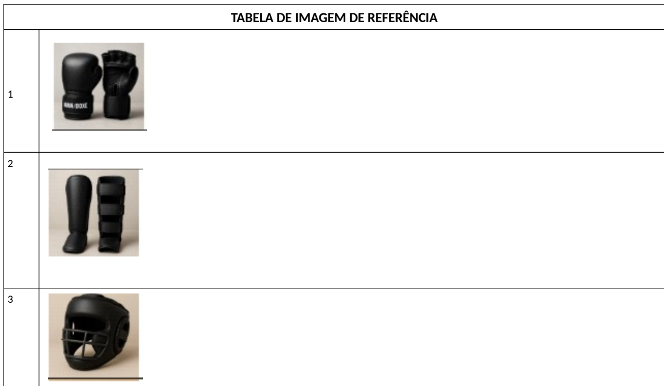
TABELA DE IMAGEM DE REFERÊNCIA