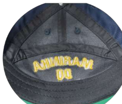
Figura 10 – Parte interna do gorro (entretela na parte frontal, carneira, viés de limpeza, ilhoses)