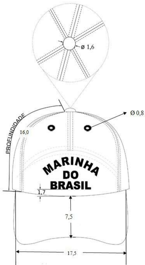
Figura 2 – Medidas do gorro em cm (frontal e superior)