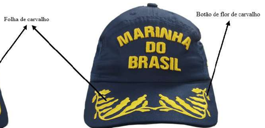
Figura 5 – Vice-Almirante e Contra-Almirante (1 botão de flor intercalando com 2 folhas de carvalho na parte superior e 6 botões de flores na parte inferior do ramo)