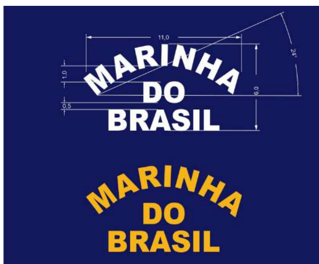
Figura 15 – Medidas MARINHA DO BRASIL, bordada na parte frontal do gorro.