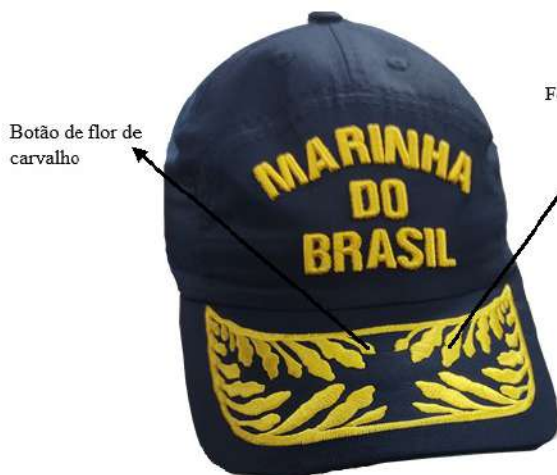
Figura 4 – Almirante de Esquadra (1 botão de flor intercalando com 2 folhas de carvalho)