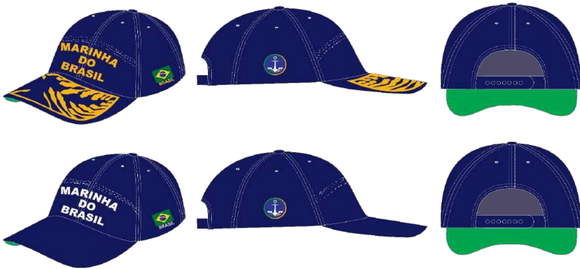
Figura 1 – Vista geral do boné