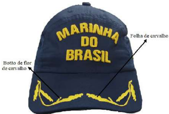
Figura 6 – Oficial Superior