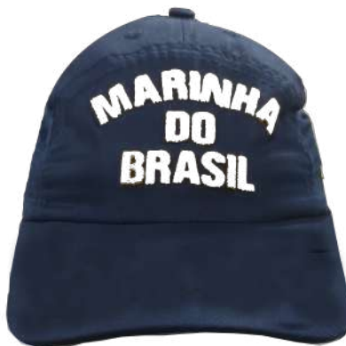
Figura 8 – Sargentos, Cabos e Marinheiros