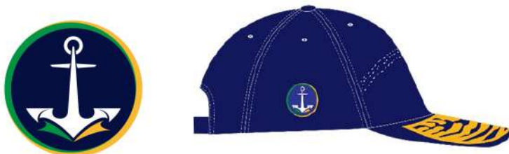
Figura 13 – Logotipo da Marinha, bordada no gomo lateral direito, com 3,0 cm de diâmetro