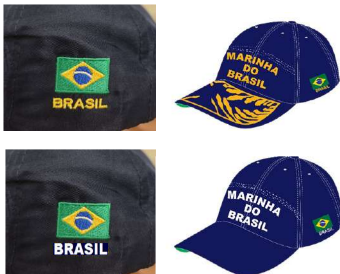
Figura 14 – Bandeira do Brasil, bordada no gomo lateral esquerdo, com 3,0 cm de comprimento e 2,0 cm de largura; e BRASIL bordado abaixo da bandeira, em fonte ARIAL BLACK, com 3,0 cm de comprimento total, com bordado amarelo para OF e SO, e branco para SG, CB e MN.