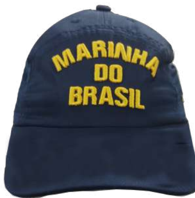
Figura 7 – Oficial Intermediário, Oficial Subalterno e Suboficial