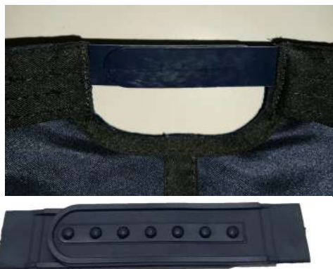
Figura 11 – Semicírculo traseiro e fecho regulador plástico azul marinho