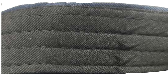
Figura 12 – Carneira espumada de 3,0 cm de largura, com pespontos