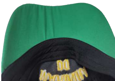
Figura 9 – Parte interna da aba