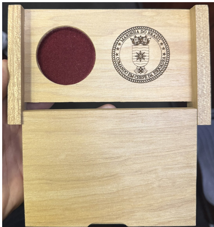
Figura 2: Apresentação caixa aberta com articulação em 180°