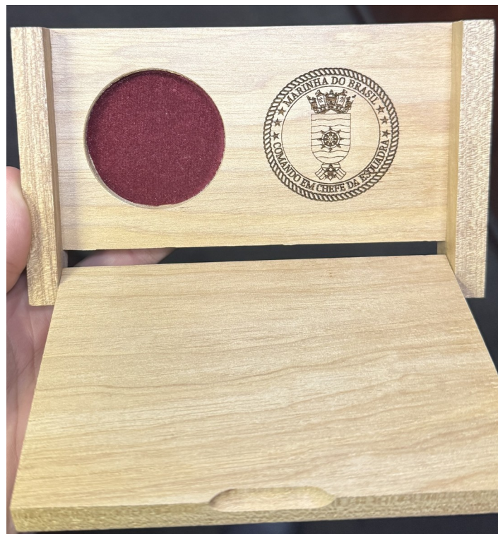
Figura 1: Apresentação caixa aberta com articulação em 90°