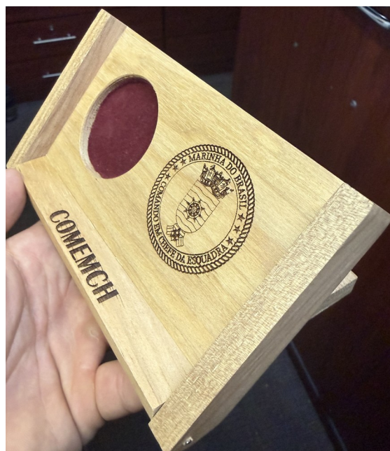
Figura 3: Apresentação caixa aberta com articulação em 270°

1.2 O objeto desta contratação não se enquadra como sendo de bem de luxo, conforme Decreto nº 10.818, de 27 de setembro de 2021.