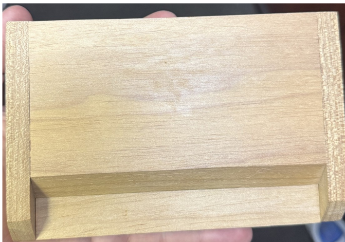
Figura 4: Apresentação caixa fechada