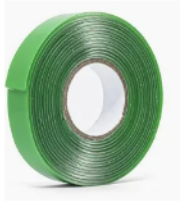
Item 2 - Fita adesiva dupla face fixa forte 9,5mm x 20m