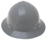
Item 5 - Capacete de segurança, aba total com jugular