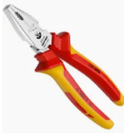
Item 6 - Alicates universais 8 polegadas