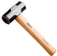
Item 8 - Marreta de aço, cabeça dupla oitavada, 2 Kg