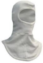
Item 3 - Capuz anti-flash