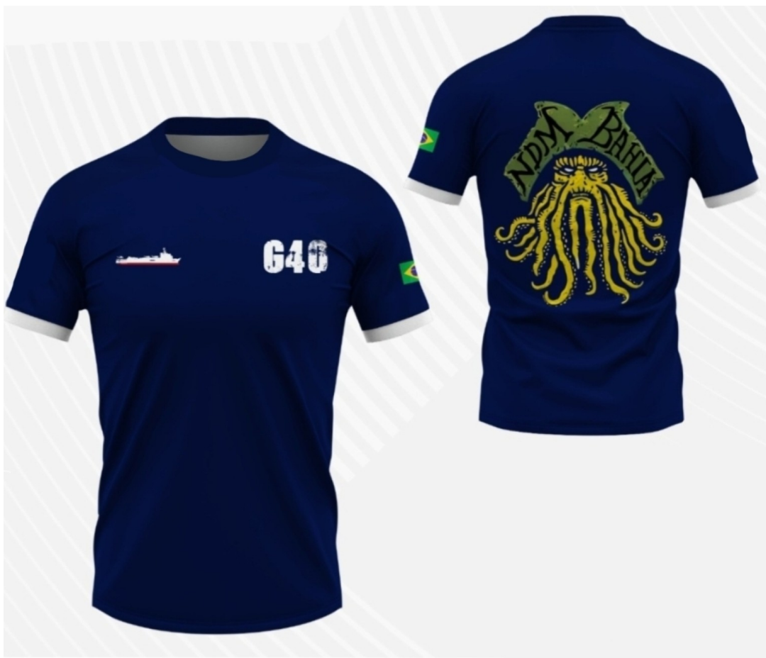
Figura 1 - Modelo de referência da camisa, com visualização da frente e das costas.

Referência visual e especificações para produção