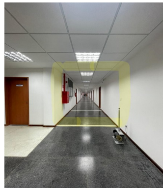
Local a ser instalada