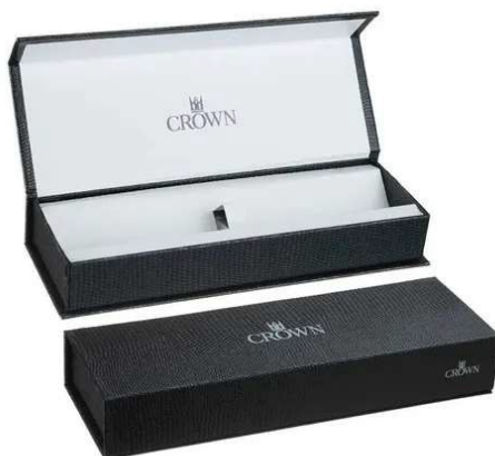
IMAGEM DA MINERVA