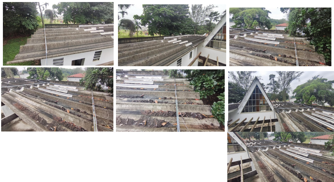
5.7.4. Goteiras geradas em virtude do desgaste do telhado.