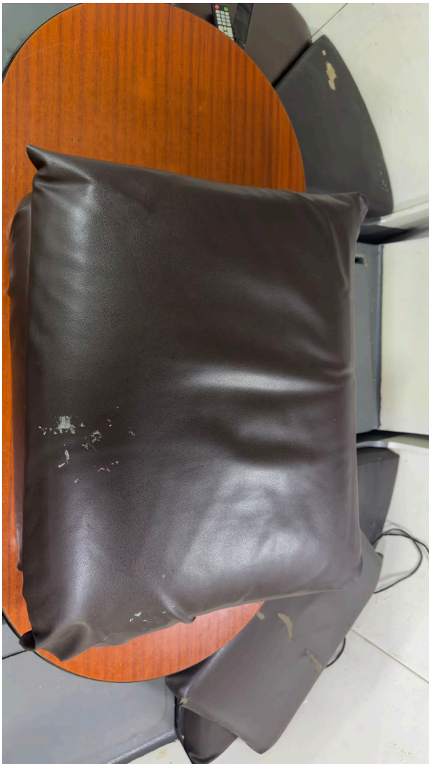
Figura 4 – Almofada horizontal com desgaste superficial do revestimento.