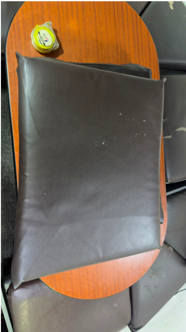
Figura 6 – Almofada vertical apresentando rasgos e deterioração do revestimento.