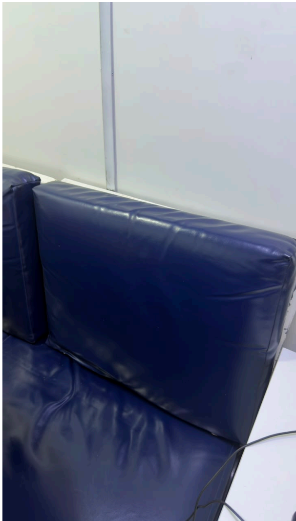
Figura 10 – Detalhe do conjunto de assentos e encostos da Praça D’Armas.