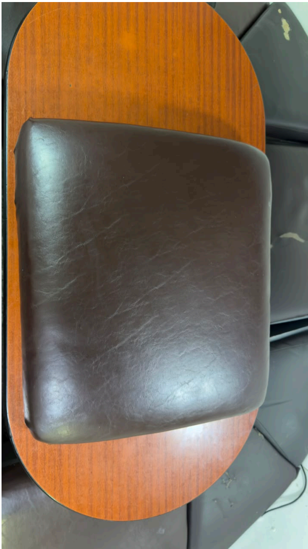
Figura 5 – Almofada vertical apresentando pontos de desgaste e marcas de uso.