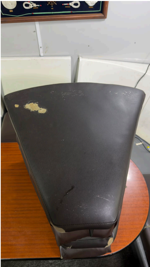
Figura 7 – Almofada horizontal apresentando perfurações e desgaste nas extremidades.