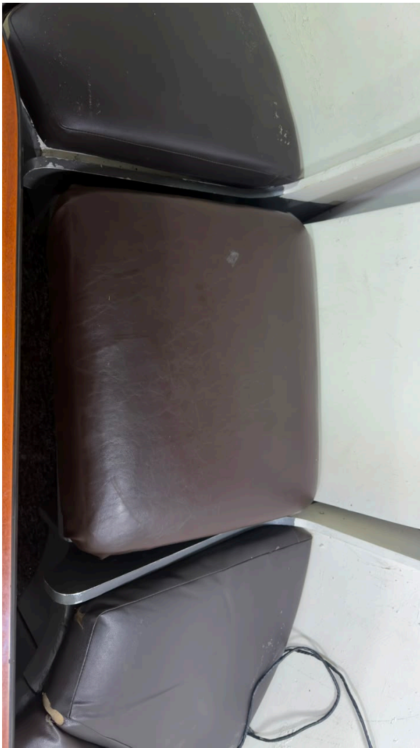
Figura 3 – Almofada vertical apresentando descascamento do revestimento sintético.