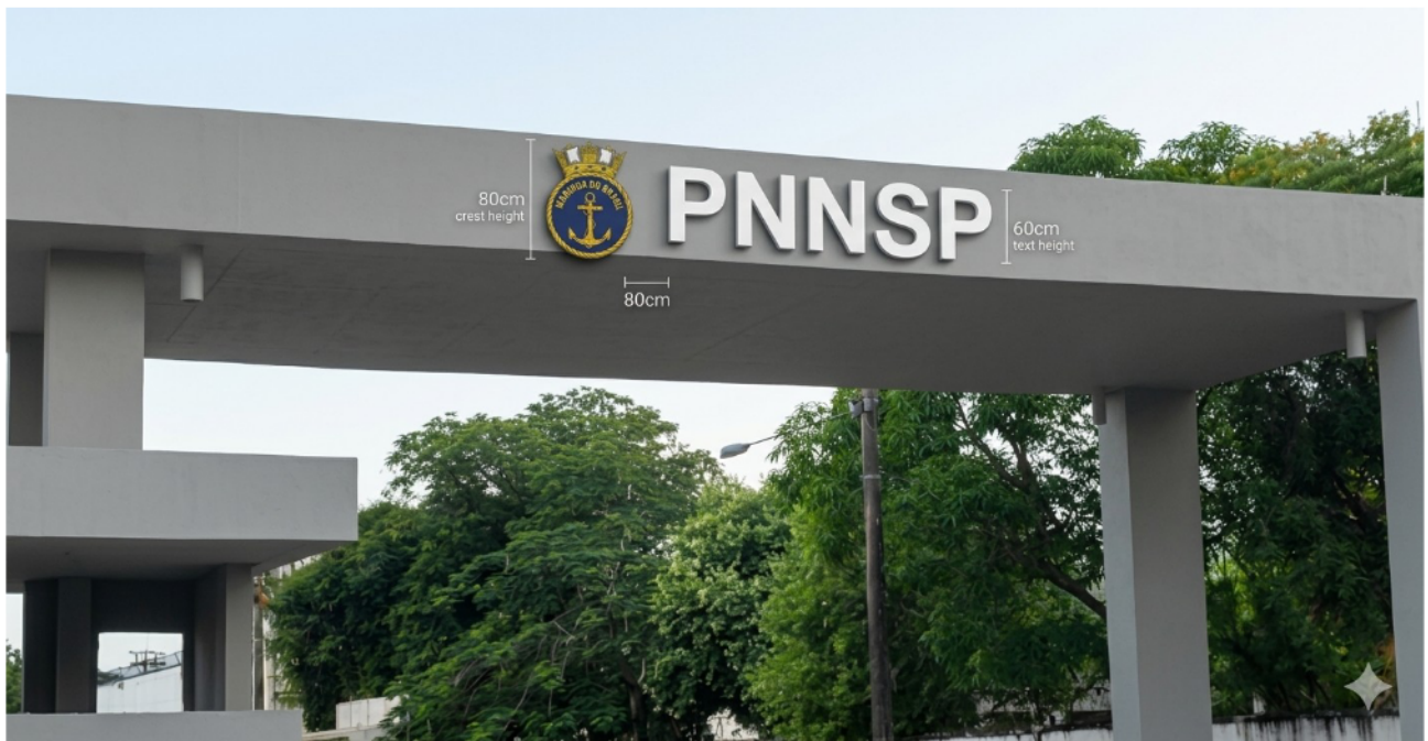
Figura 1.2: Imagem meramente ilustrativa gerada por IA.