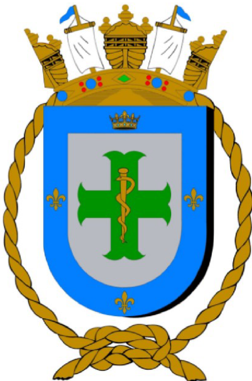
Figura 4.2: Brasão institucional a ser usado como modelo do Brasão em bronze