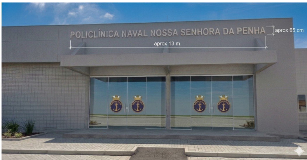
Figura 1.1: Imagem meramente ilustrativa gerada por IA.

FRENTE B - Letreiro com Sigla e Heráldica, será composta de forma integrada pela Heráldica oficial, representada pelo Brasão da Marinha do Brasil, seguida da sigla organizacional "PNNSP" em caixa alta. O padrão construtivo da sigla será idêntico aos padrões estabelecidos para a Frente A, utilizando PVC expandido de 30 mm, usinagem CNC, tratamento com primer e pintura PU automotiva na cor branca acetinada com proteção UV, montagem flutuante oculta e pinos em aço inox AISI 304 ou AISI 316. O padrão construtivo da Heráldica utilizará base estrutural em PVC expandido de alta densidade com espessura de 30 mm, recortada em Router CNC acompanhando o contorno externo oficial do brasão, recebendo na face frontal a aplicação de adesivo vinílico polimérico de alta performance para envelopamento e comunicação externa, com impressão digital direta de alta resolução de no mínimo 1440 DPI, finalizado com laminação protetora transparente fosca com filtro UV ativo para garantia de fidelidade cromática e resistência ao desbotamento. As dimensões de referência da Frente B apresentam altura nominal aproximada de 80 cm para a Heráldica e altura média de 60 cm para as letras da sigla, mantendo-se a proporcionalidade geométrica e possuindo caráter meramente orientativo e referencial.