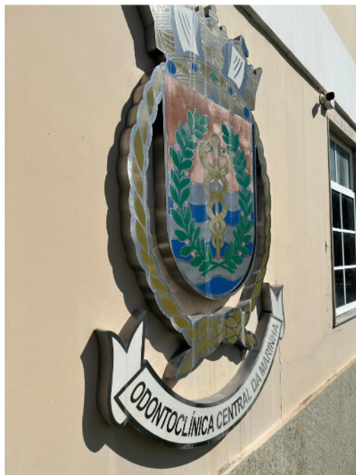
Figura 3.1: Brasão da Odonto Clínica Central da Marinha (OCM) usado como referência ilustrativa

O sistema de fixação será do tipo ancoragem estrutural oculta, mediante a utilização de suportes, pinos ou subestrutura equivalente de engenharia que proporcione o recuo planejado em relação ao plano da parede para efeito flutuante, garantindo perfeito alinhamento horizontal, estabilidade mecânica contra a ação de ventos de grande magnitude, segurança estrutural e vedação ativa contra infiltrações de água pluvial na alvenaria. Todos os elementos de fixação metálicos, inserts , parafusos ou chassis de suporte serão obrigatoriamente confeccionados em aço inoxidável padrão AISI 304 ou AISI 316, ficando totalmente vedada a utilização de ligas ferrosas comuns, impossibilitando a ocorrência de oxidação e o surgimento de patologias ou manchas de ferrugem na fachada do prédio.