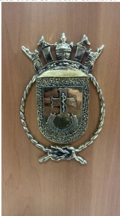
Figura 4.1: Imagem de referência meramente ilustrativa