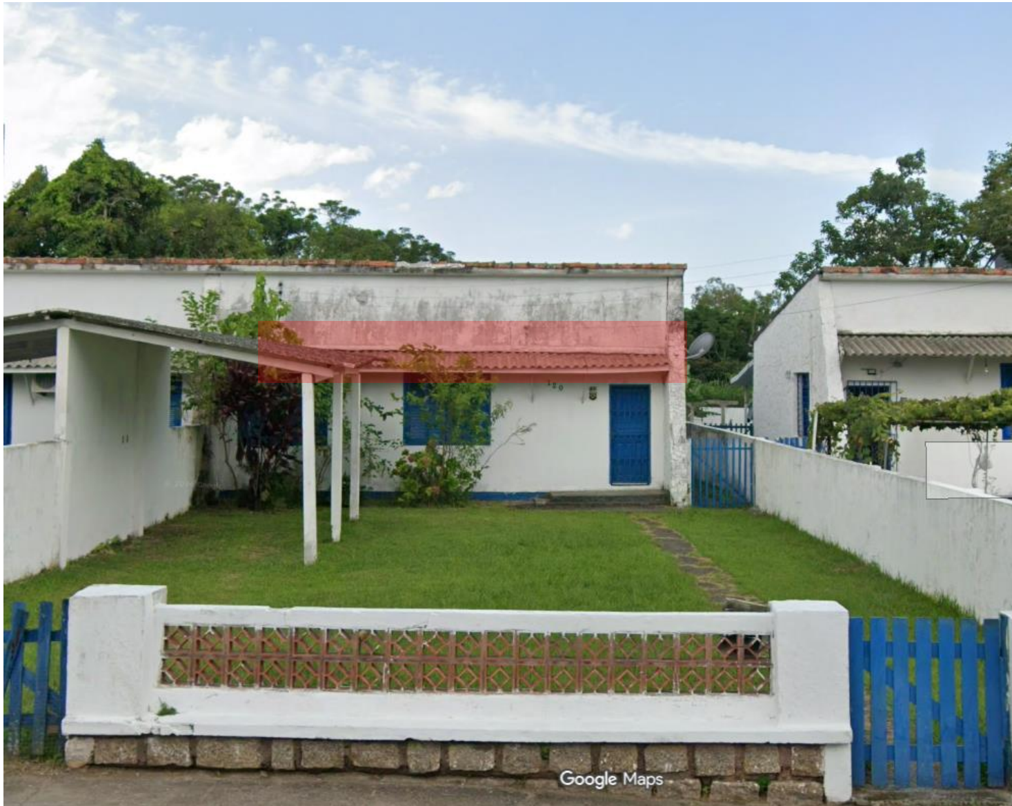
FIGURA 03 – FACHADA