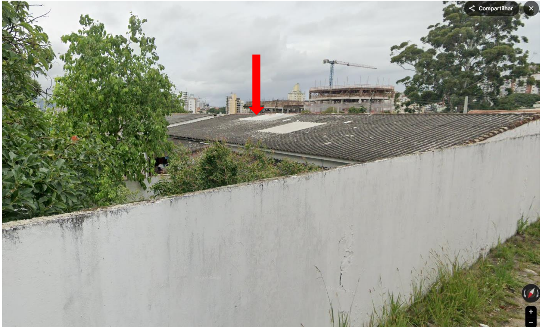
FIGURA 02 – VISTA LATERAL