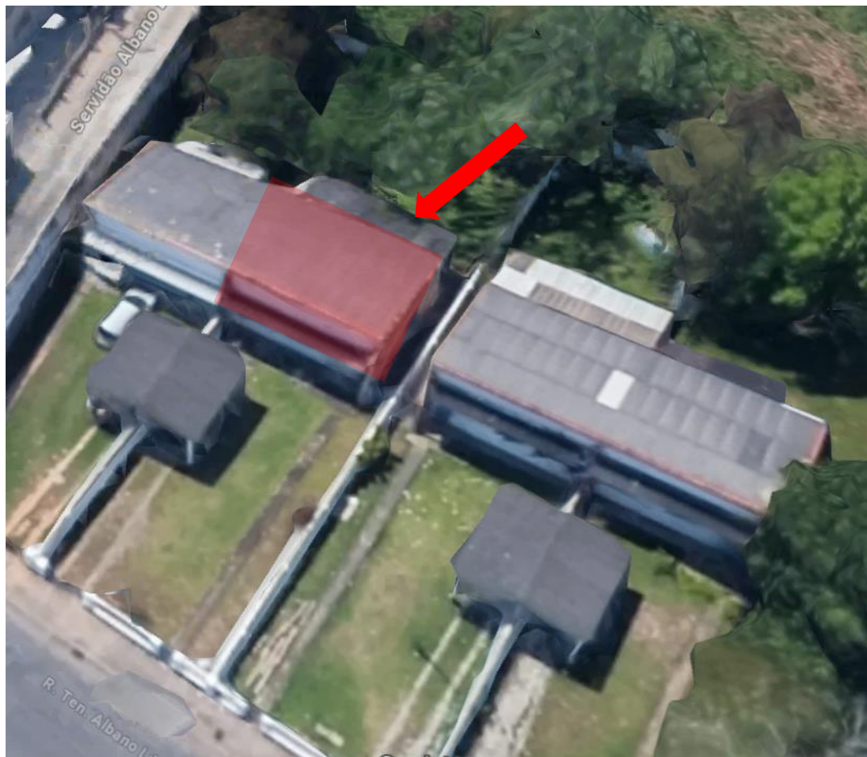
FIGURA 01 – IMAGEM AÉREA