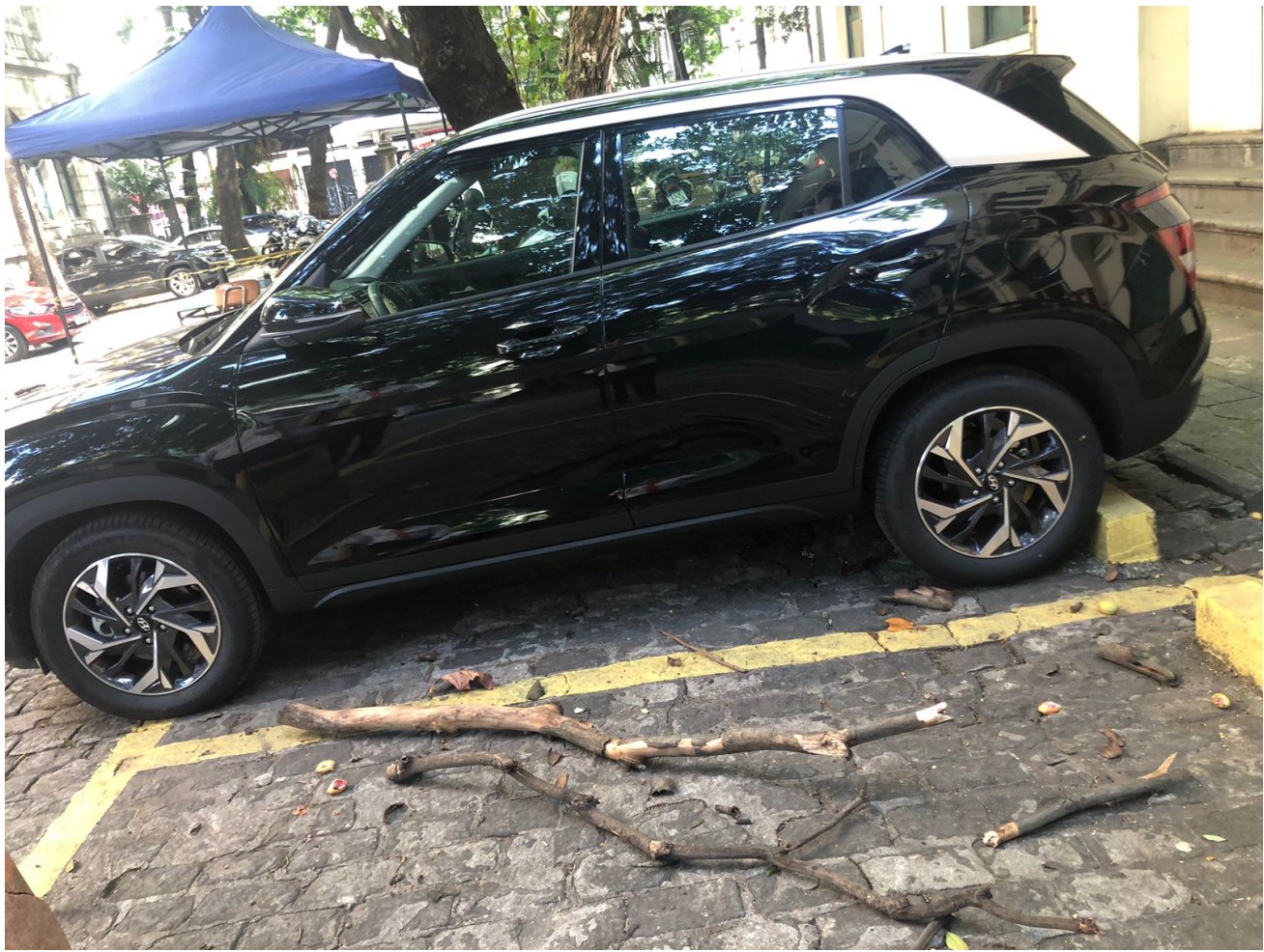
Unidades HC3 e HC4