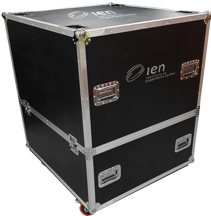
Legenda: Case de Transporte