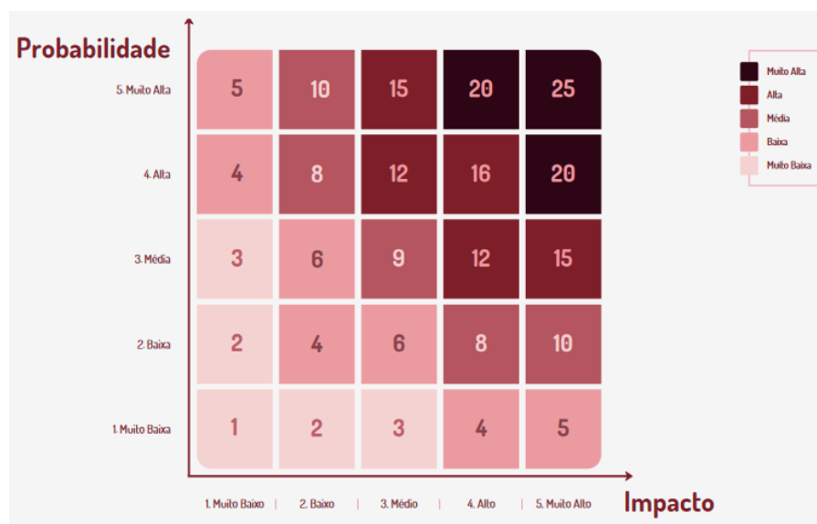
Figura 1: Matriz classificação dos níveis de risco

A Figura 1 apresenta a Matriz Probabilidade x Impacto, instrumento de apoio para a análise e definição dos critérios de classificação do nível de risco. Contudo, essa análise somente se completa quando ações de tratamento e resposta aos riscos são implementadas e mensuradas.