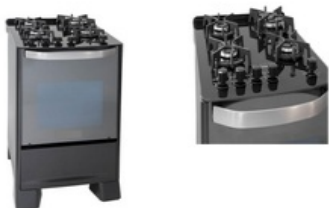
FOGÃO GÁS GLP

em uso. Estrutura lateral/pés: Estrutura metálica lateral em tubo de aço SAE 1010/1020 oblongo 50x20x1,5mm. Pés em chapa de aço 1010/1020 com 2,5mm de espessura, com largura de 65mm e profundidade de 300mm Revestimento: toda estrutura metálica com tratamento de desengraxe, decapagem e fostatização, pintura tinta epóxi-pó. Especificações: Largura do assento: 900mm Profundidade do assento: 470mm Profundidade do assento e do encosto rebatido: 330mm Largura do encosto: 900mm Altura do encosto: 520 mm Cor: Vermelha