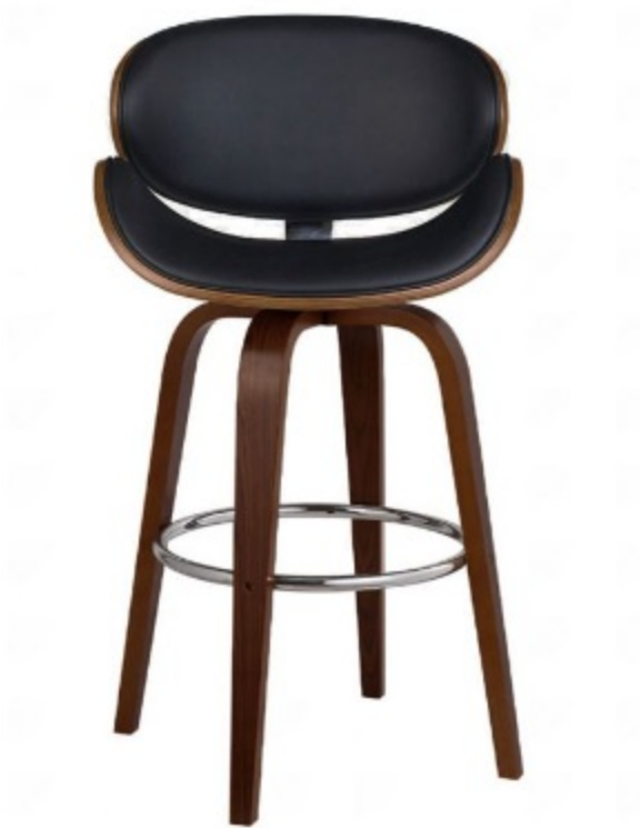
Imagem referencial do produto