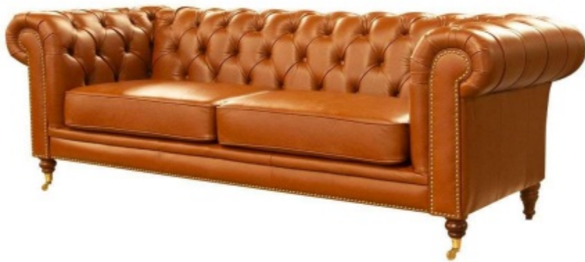
Imagem referencial do produto