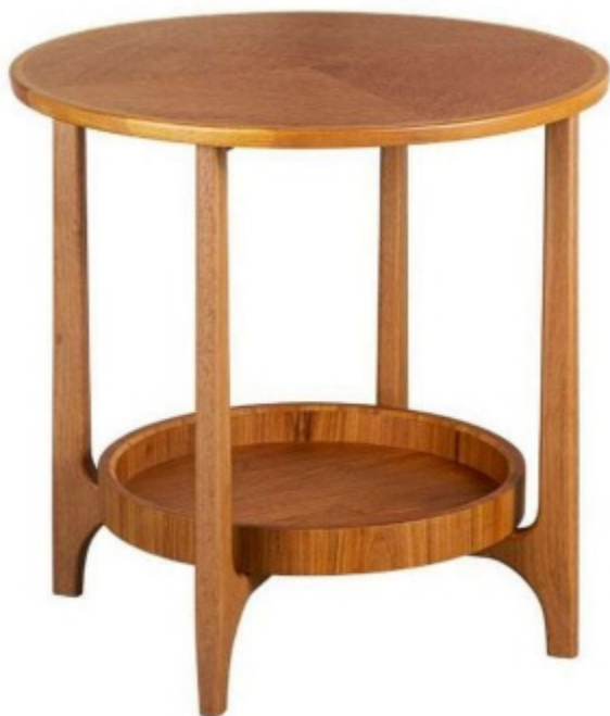
Imagem referencial do produto