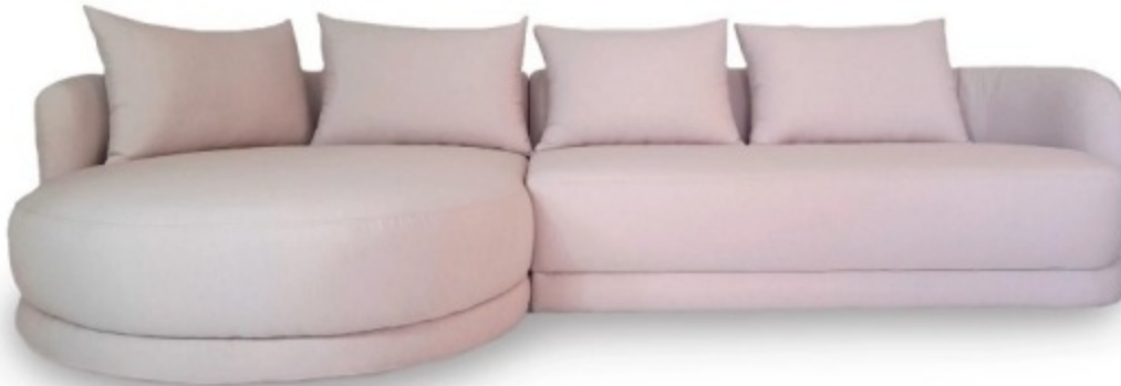
Imagem referencial do produto