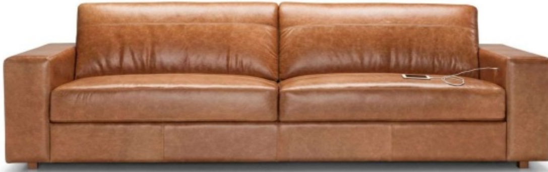
Imagem referencial do produto