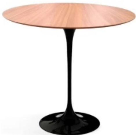
Imagem referencial do produto

* ATENÇÃO: Ocorrendo divergência entre a descrição do produto constante no código SIASG (CATMAT) e no Termo de Referência, prevalecerá a descrição deste último.