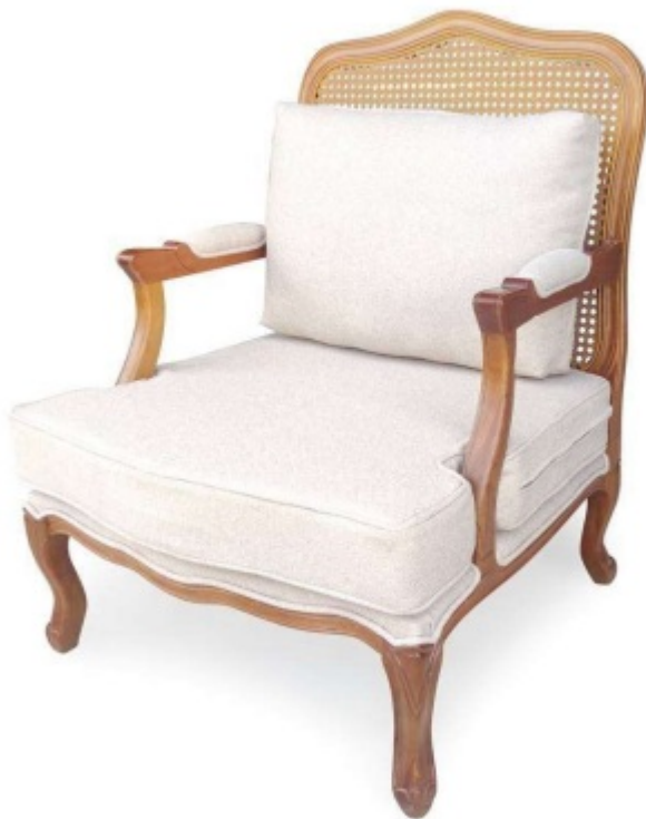
Imagem referencial do produto