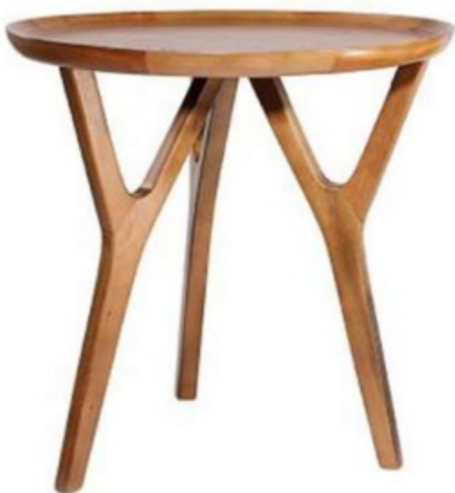
Imagem referencial do produto