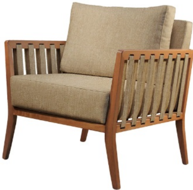
Imagem referencial do produto