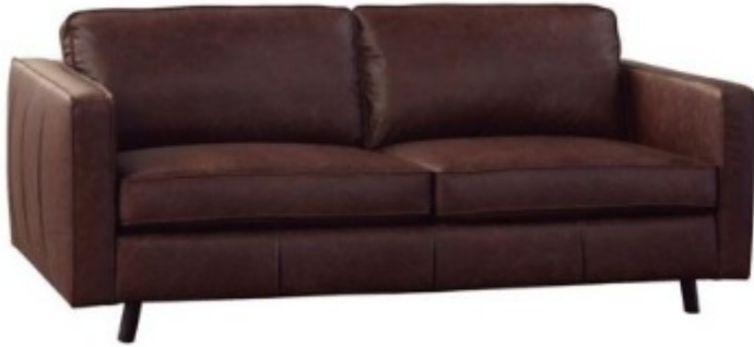
Imagem referencial do produto