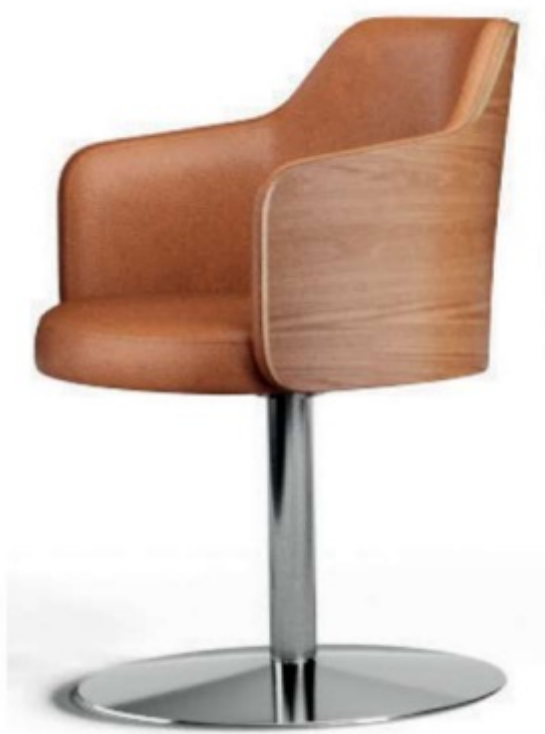
Imagem referencial do produto