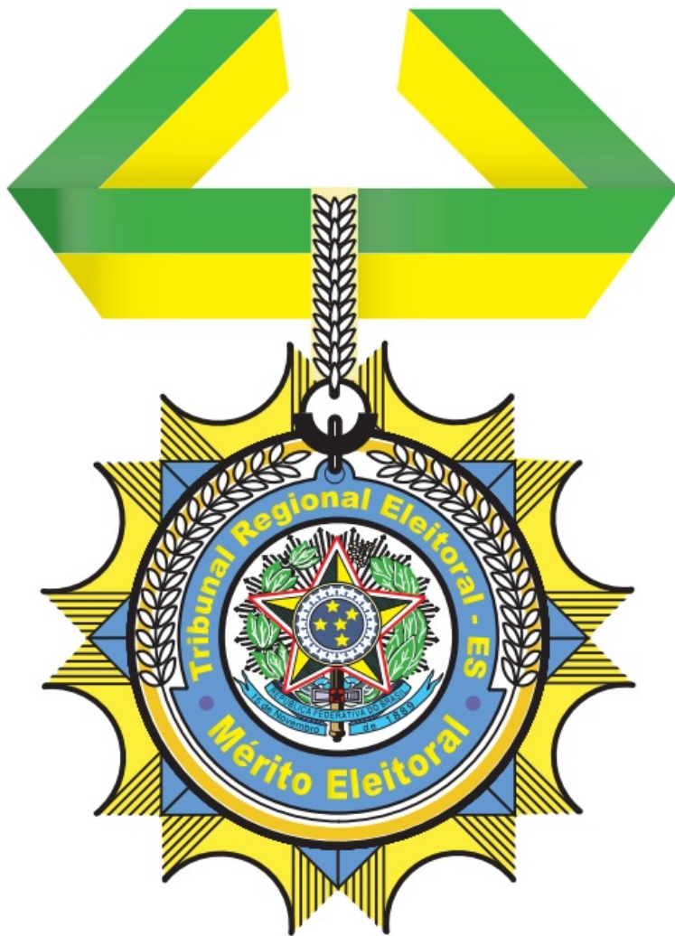
Medalha de Mérito Eleitoral - medidas