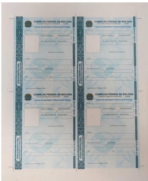
Disposição por folha A4