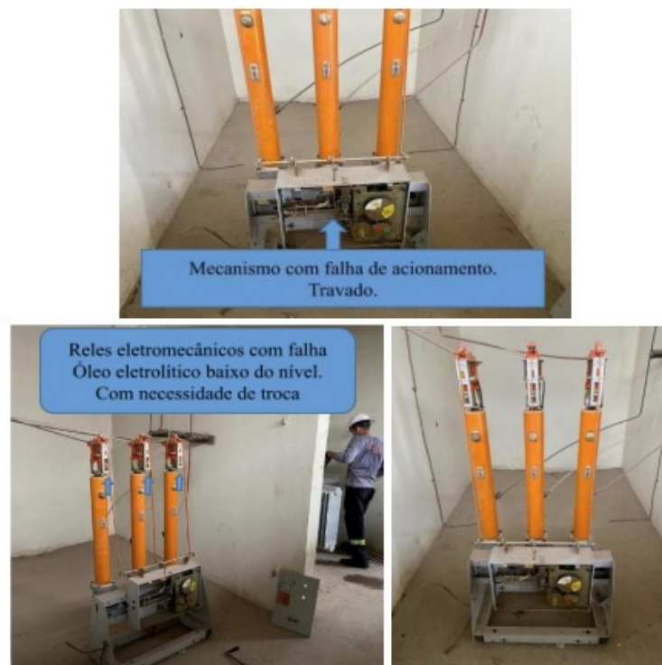
Figura 1 – Disjuntor de Média Tensão (P.V.O.) com falha mecânica.