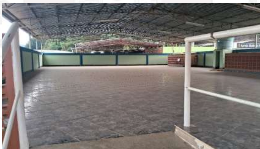
Ambiente da solenidade