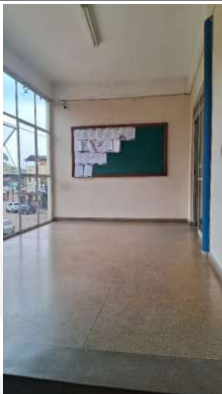
Ambiente segunda entrada