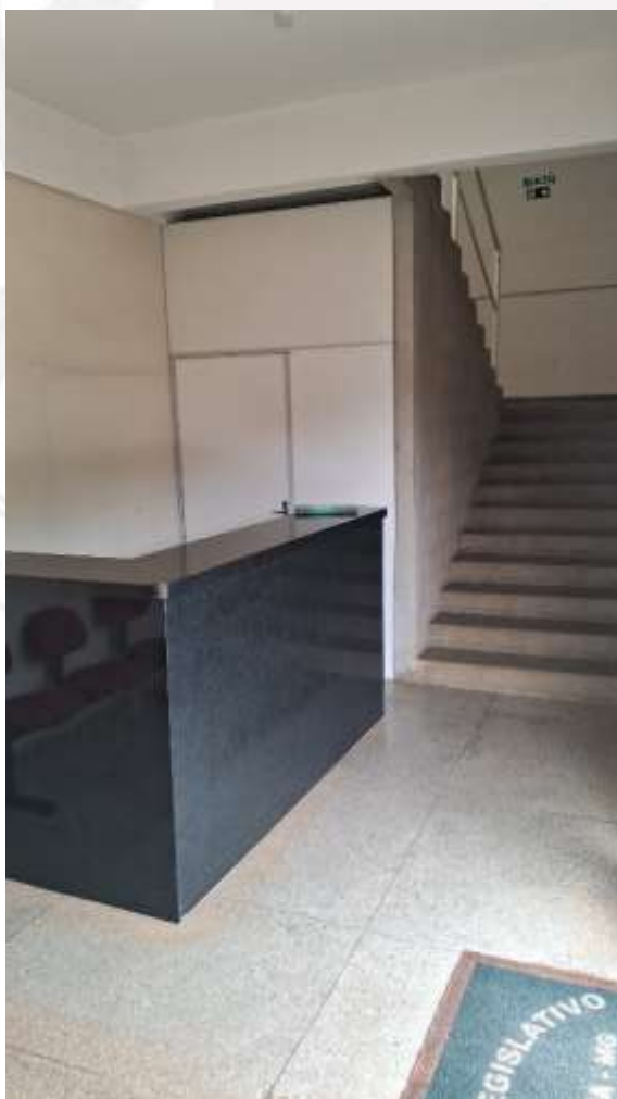
Ambiente primeira entrada

- Segunda entrada: backdrop - ambiente para foto, fechamento de tecido para fundo e lateral, 01 sofá, compoendo a decoração do ambiente arranjo de capim dos pampas, folhas de latânia e flores permanentes, para o chão cilindros de vidro com velas; Convidados: 25 mesas, 25 tampos, 25 toalhas adamascadas, 25 centros de mesa, 200 cadeiras de ferro; Ambiente Buffet: 01 mesa para aparador, 01 arranjo; Autoridades: 01 mesa para autoridades, 09 cadeiras, 01 arranjo rasteiro composto a frente da mesa, tapete vermelho de 25 metros tipo passarela ao centro; Mesa para doces: 01 mesa para doces, suporte para doces, conjunto de 01 arranjo aéreo; Salão: fechamento de tecido para todo o ambiente, lateral e teto. Abaixo fotos dos ambientes: