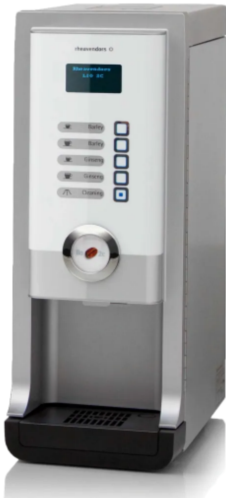
Imagem de referência.

4.5.2. Para fins de prova de que o objeto ofertado atende integralmente às exigências deste Termo de Referência, a licitante deverá apresentar, obrigatoriamente junto à sua proposta comercial, o catálogo técnico ou prospecto original do fabricante , nos termos do Art. 17, § 3º, da Lei nº 14.133/2021 .