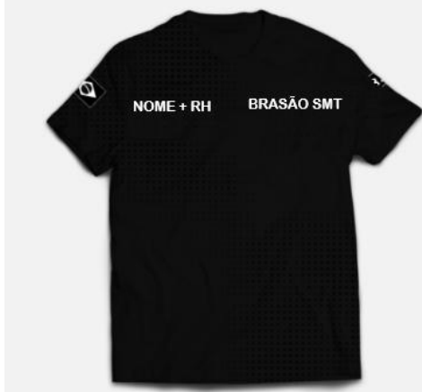
07-CAMISA SOCIAL (COR PRETA)