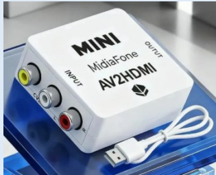
(IMAGEM DE REFERENCIA)