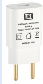
(IMAGEM DE REFERENCIA)