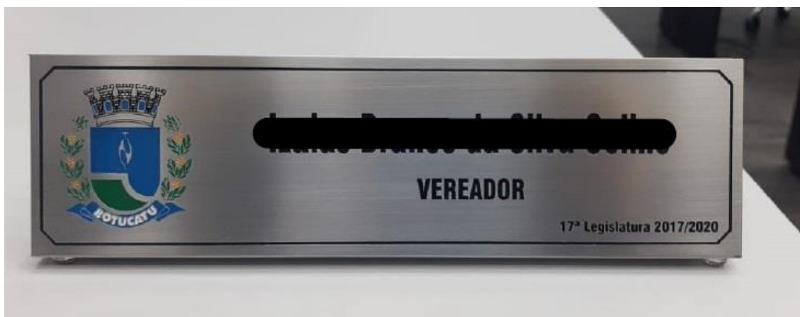
Prisma - Vereador - Visão Frontal