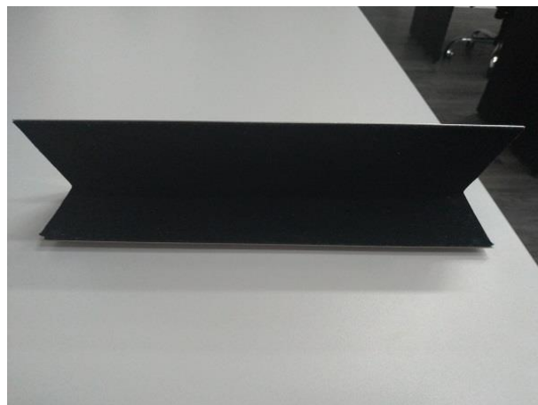
Prisma - Parte Traseira