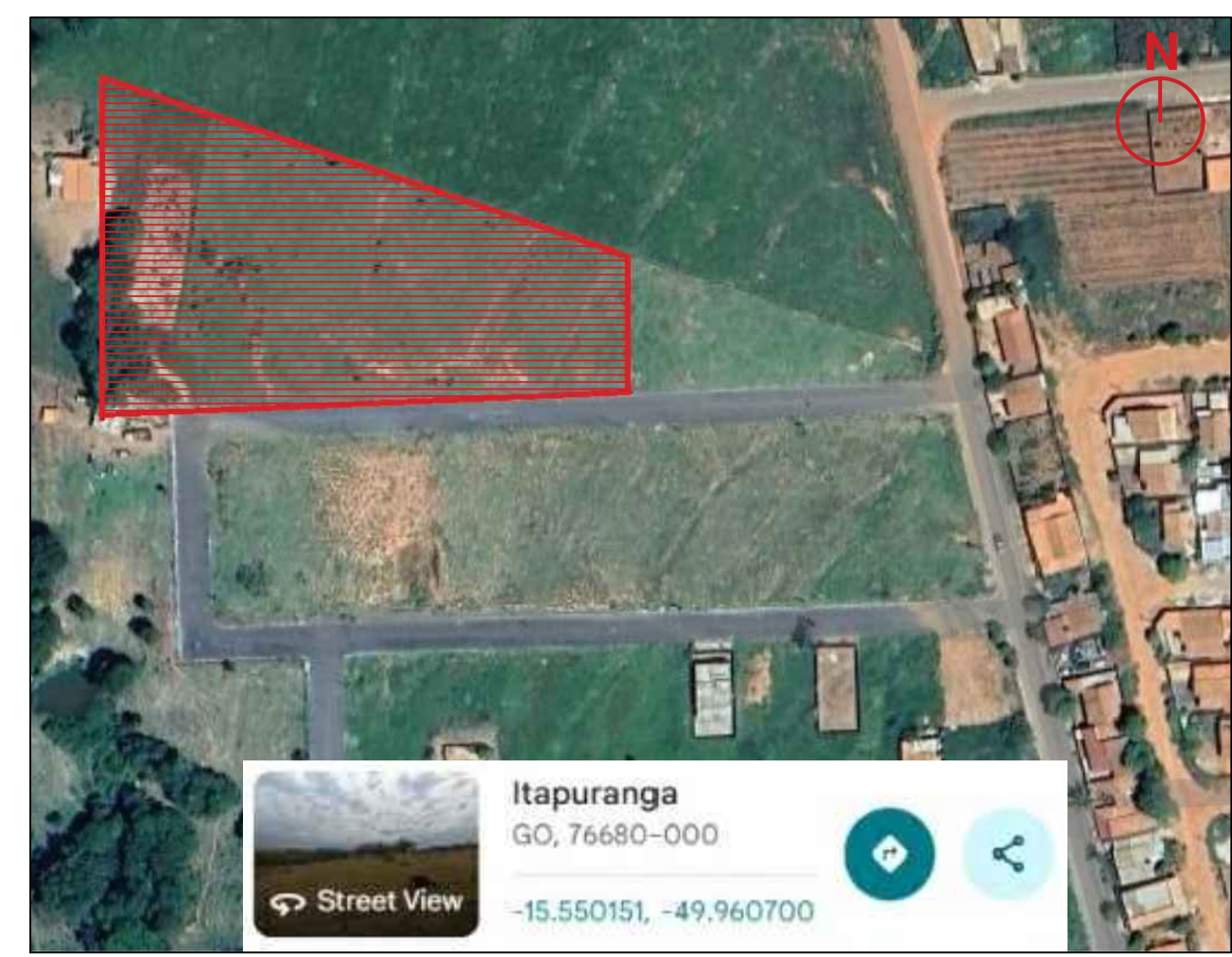
VISTA SATÉLITE - LOCALIZAÇÃO