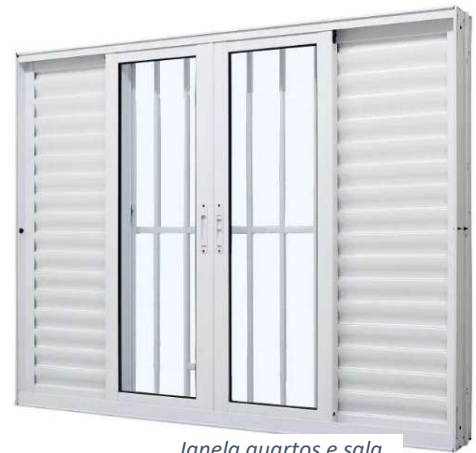
Janela quartos e sala