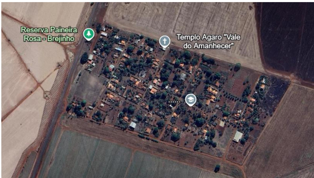
Povoado de Brejo Bonito

2.1. A obra de construção do Campo de Futebol Society e Complexo Esportivo no Município de Bom Jesus/GO, no Município de Bom Jesus de Goiás/GO.