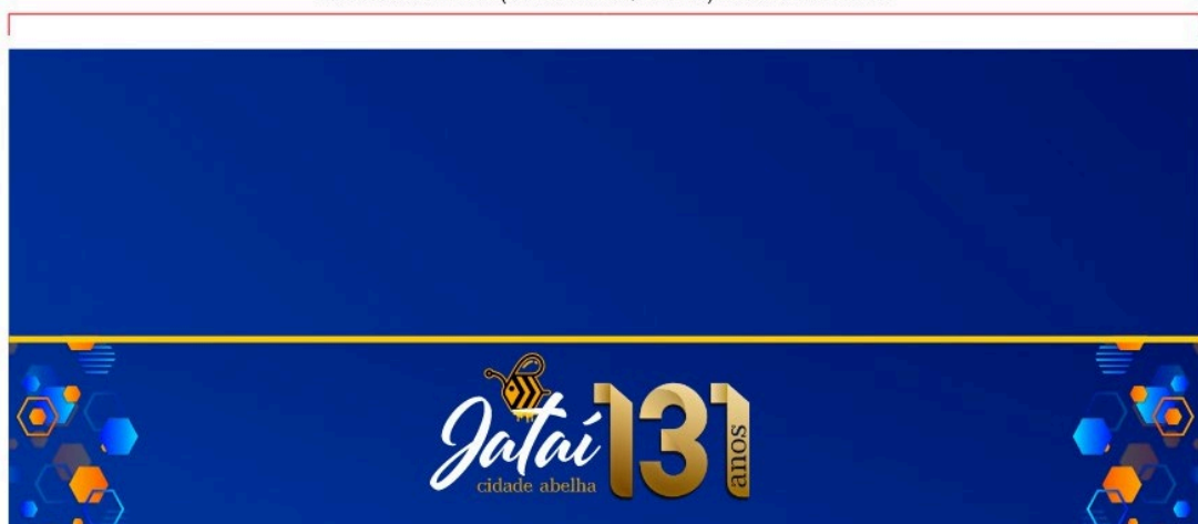
PAINEL LATERAIS (DIREITA/ESQUERDA) 10,0 X 4 METROS