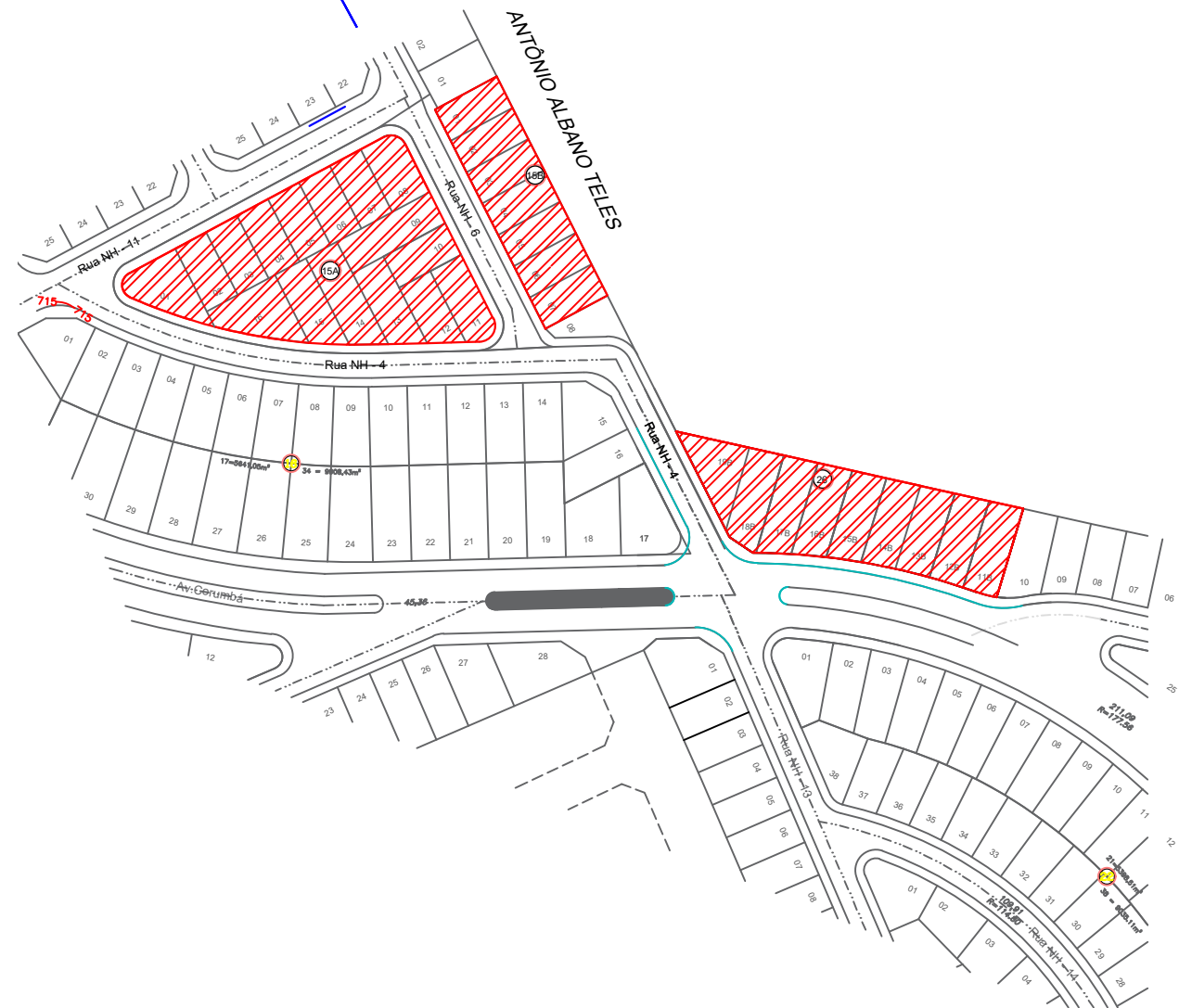
LOCALIZAÇÃO LOTEAMENTO NOVO HORIZONTE ESC.: 1/2000